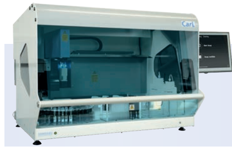
CarL Complete automation of recomLine